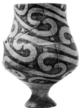
Ceramică de tip Cucuteni, datând de câteva mii de ani

Dacă aveți în față o hartă fizică a României, observați cum arată Podișul Transilvaniei: s-ar zice că țara noastră este un fel de mare cerc în jurul Transilvaniei. Ei bine, acolo s-a născut neamul românesc.