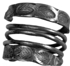
Inel dacic de argint din secolul I d.Cr. Face parte din tezaurul de la Măgura, județul Teleorman.

Iar la sud de ei se găseau tracii. Mulți istorici cred, pe baza unei singure propoziții a istoricului grec Herodot (secolul al V-lea î.Cr.), că și geto-dacii erau o ramură a tracilor. Astăzi se pare că nu e chiar așa. Ar fi fost rude apropiate ale tracilor, dar limbile (puținul cât a mai rămas din aceste limbi) nu se potrivesc sută la sută, nu avem la geto-daci aceleași nume de localități,